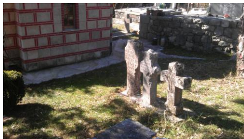
ТРИ КРСТА из ПРЕБИЛОВАЦА (18, 19 и 20.век), пренети 1995.г. крај Цркве Васкрсења на Гробљу Ман.Тврдоша

+ Епископ Атанасије (1992–2013, Манстир Тврдош-Требиње)